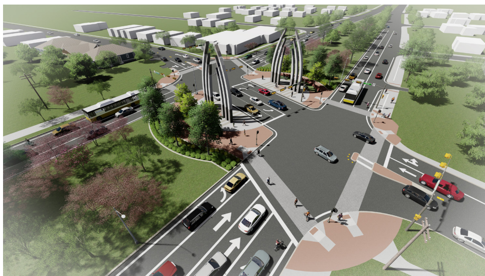
PINE STREET & S.M. WRIGHT | ESQUINA DEL SURESTE MIRANDO AL OESTE