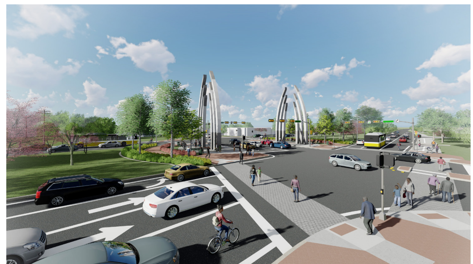
PINE STREET & S.M. WRIGHT | ESQUINA DEL SURESTE MIRANDO AL OESTE